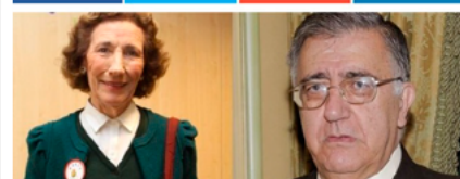
La Vanguardia 19 de junio

OR EUNOIA, PRESS EVILLA, 20/06/2017 - 19:23